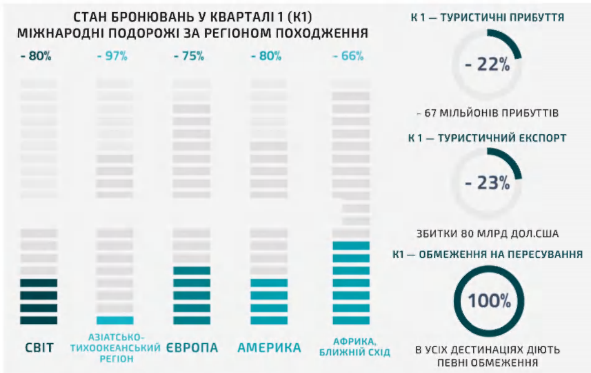
Рис. 7.6. Вплив пандемії COVID-19 на світовий туризм У першому кварталі 2020 року