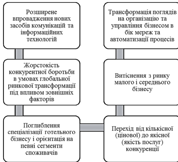
Рис. 1. Основні тенденції у сфері розвитку готельного бізнесу м. Чернівців*

На сьогодні основні тенденції розвитку готельної індустрії міста Чернівці можна систематизувати наступним чином (рис. 1).