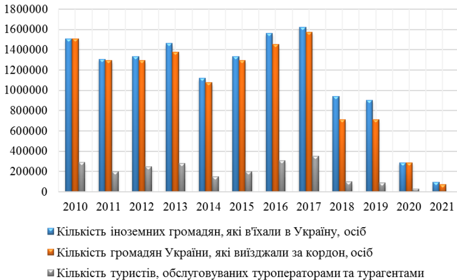
Рис. 3. Зміна туристичних потоків у м. Чернівці*

*Джерело: розроблено автором за даними [12].