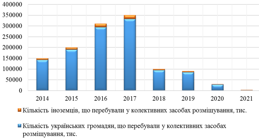
Рис. 4. Динаміка чисельності українських громадян та іноземців, що перебували у колективних засобах розміщення, за 2014–2021 рр., тис. осіб*

споживача обслуговуванням, відпочинком, виконанням бажань, через відчуття комфортності, атмосфери готельних послуг, безпеки і рекреаційної оздоровлюючої дії.