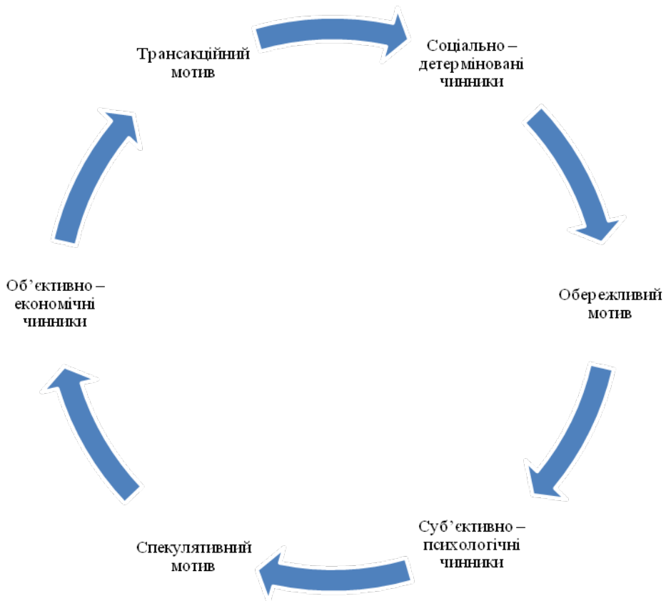
Рис. 2. Зв'язок між чинниками попиту на гроші та мотивами грошового накопичення