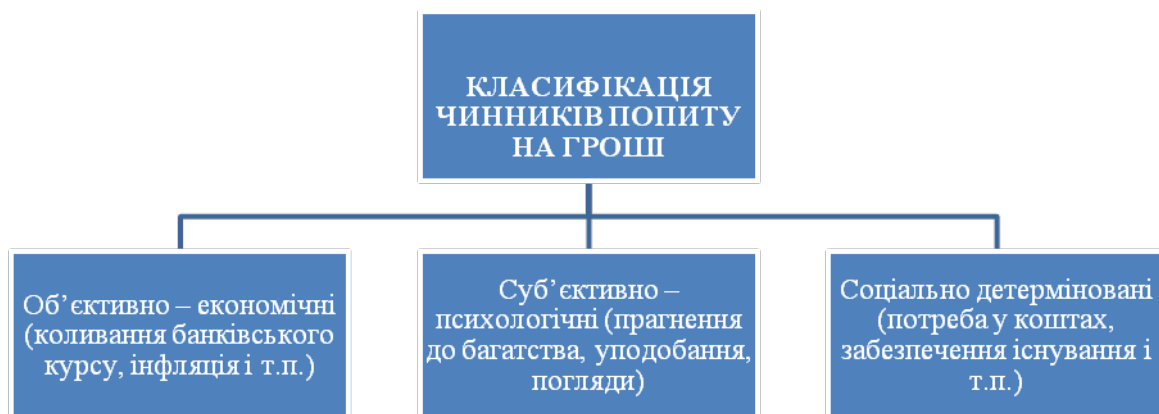
Рис. 1. Класифікація чинників попиту на гроші

На рис. 3 наведено (в якості узагальнення) класифікацію теорій грошового попиту (рис. 3).