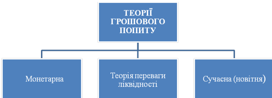
Рис. 3. Класифікація теорій грошового попиту