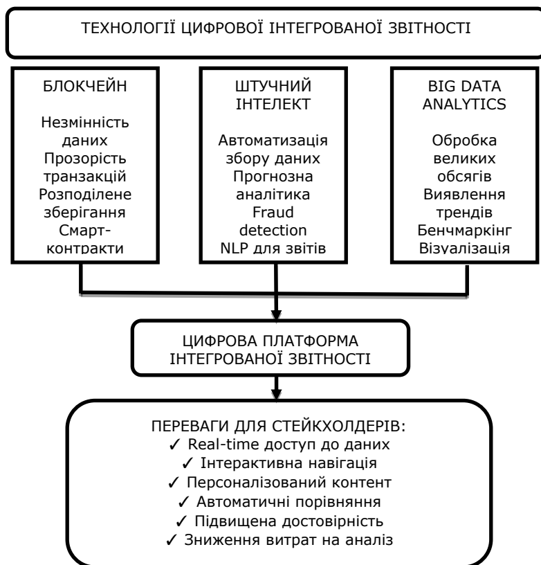
Рис. 2. Архітектура цифрової інтегрованої звітності на основі сучасних технологій*

підвищення прозорості та оперативності розкриття інформації (рис. 2).