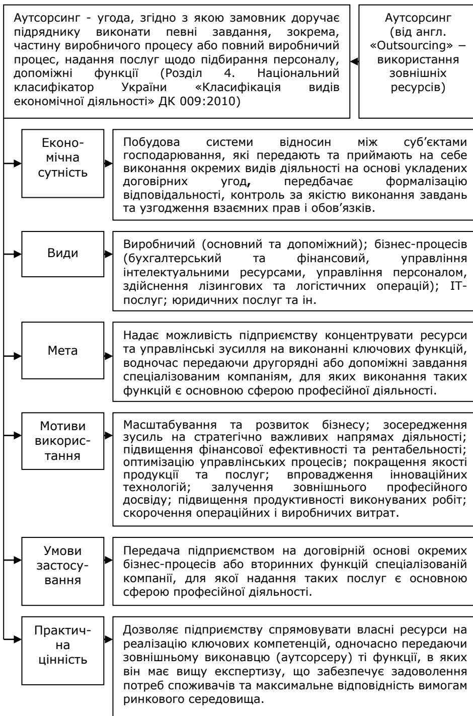
Рис. 1. Узагальнена характеристика аутсорсингу*