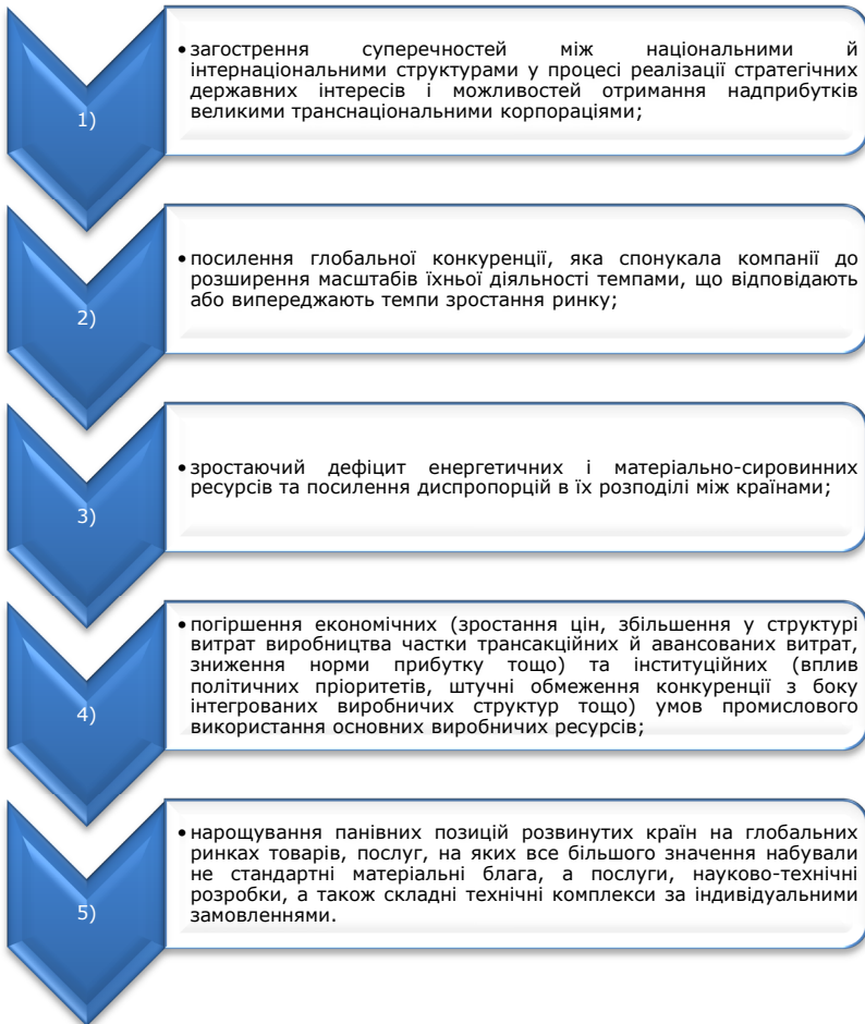
Рис 1.4. Диспропорційні зміни розвитку в реальному секторі світової економіки*

*Розроблено на основі джерел [2; 29; 35; 39].