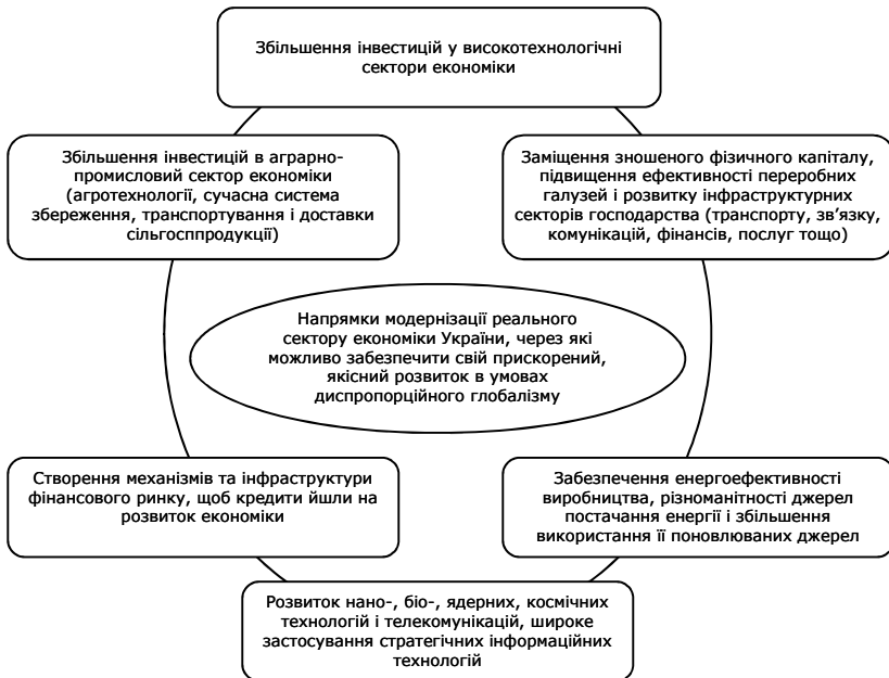
Рис. 1.6. Економічні та адміністративні механізми подолання диспропорційного розвитку економіки України в умовах глобалізму

проблема полягає не тільки в розмірах запозичень, а й в їх використанні, адже кошти, які надходили в Україну, в основному йшли на споживчий ринок, стимулюючи таким чином імпорт товарів. Відносно високий відсоток і низька рентабельність створювали зворотний ефект: корпорації і банки позичали за кордоном, але ж вкладати з рентабельністю в 20% в Україні можна тільки в рамках самої фінансової системи. Тому зовнішній приватний борг країни наростає, а структура економіки і виробничі сектори продовжують руйнуватися і деградувати, втрачаючи позиції навіть на внутрішньому ринку. Таким чином, створилася залежність від зовнішнього кредиту при порушенні механізмів внутрішнього капіталоутворення. Відрив фінансового сектору від виробничих секторів був спровокований внутрішніми інститутами і підігрівався ззовні. Він відображає структурні диспропорції світової економічної глобалізованої системи, відсутність дієвих обмежень і управління фінансовою системою, надмірність фінансових інструментів і некерованість фінансових потоків [6, с.21].