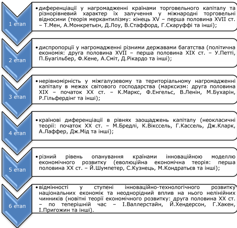
Рис. 1.2. Історичні етапи нерівномірного розвитку капіталістичної ринкової системи

світового господарства в силу об'єктивно існуючих суперечностей між ними [37, с. 5, 11-13].