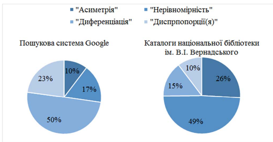
Рис. 1. Вживання понять нерівномірності розвитку регіонів

Однак, якщо актуальність завдання зменшення нерівномірності розвитку регіонів не викликає ніяких сумнівів, то наявність чи відсутність конвергенції в такому контексті має певні особливості. Логіка досліджень приводить нашу увагу до питання абсолютної та відносної нерівномірності розвитку, а також їх порівняння. Так, якщо економічний добробут окремої країни визначається, наприклад, реальним ВВП на душу населення та спостерігаються високі темпи його зростання, які не порівнюються з іншими країнами, то конвергенція носить вторинний характер. Однак, з іншого боку, якщо порівнювати зазначені темпи зростання з іншими країнами, то процеси конвергенції суттєво актуалізуються. Очевидно, що населення будь-якої країни, порівнюючи рівень своїх доходів буде прагнути досягнути рівня більш розвинених країн.