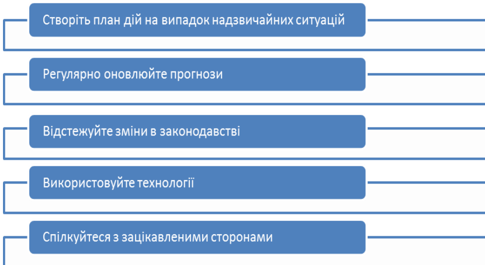
Рис. 3. Алгоритм дій для керівництва щодо ведення управлінського обліку*

Пропонуємо перелік рекомендацій щодо ведення управлінського обліку під час воєнного стану для суб'єктів господарювання України (рис. 3).