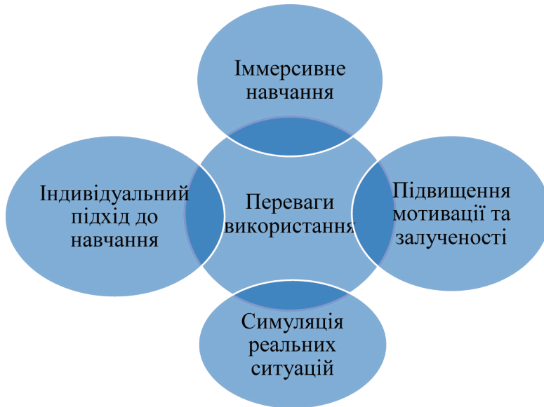
Рис. 1. Переваги використання VR

взаємодіяти, аналізувати ринкові показники та приймати рішення щодо купівлі та продажу цінних паперів у реальному часі, використовуючи англійську чи німецьку мову для комунікації.