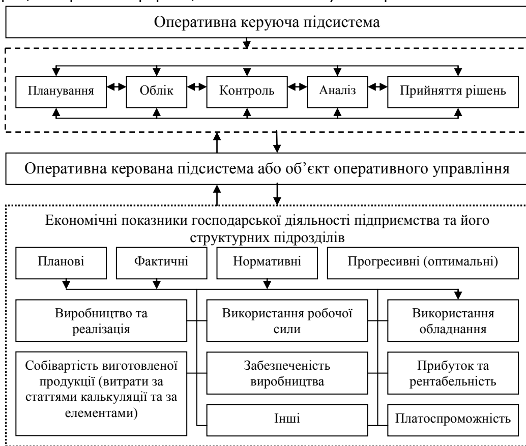
Рис. 2. Оперативне управління як система функцій управління

Оперативне управління підприємством підтримується низкою функцій (рис. 2), для кожної з яких характерний свій технологічний процес обробки інформації та спосіб впливу на керований об'єкт.