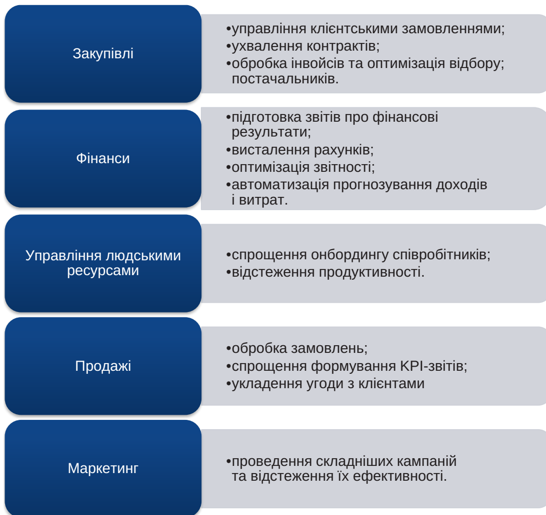
Рис. 2. Найпопулярніші напрямки автоматизації бізнес-процесів

Другий етап супроводжується детальним описом бізнес-процесів. Наявність опису є виключною необхідністю для подальшого проведення автоматизації, без нього подальші дії просто неможливі. При цьому опис можна зробити власними силами на підприємстві або за допомогою залучення зовнішніх консультантів. Для полегшення формування опису необхідно детально розібрати та відобразити всі процеси, які стосуються діяльності підприємства. На цьому етапі надзвичайно важливо виявити слабкі місця, провести коригування процесів там, де це можливо, удосконалити діяльність та сформувати мережу зворотної комунікації з клієнтами та власними працівниками, визначити ролі всіх учасників бізнес-процесу, сформувати ключові показники ефективності, а також довести усі зазначені процеси до автоматизму.