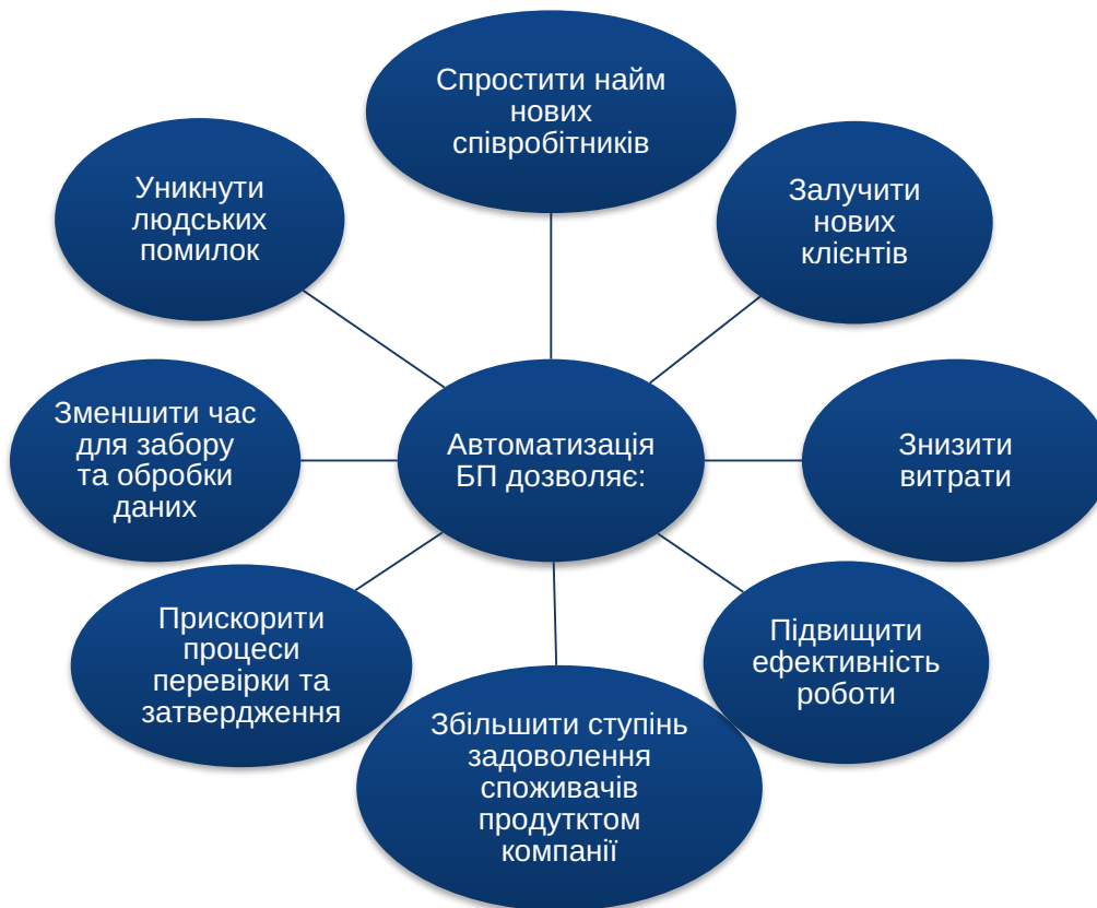
Рис. 1. Переваги автоматизації бізнес-процесів підприємства

Закономірно, що перш ніж розпочати автоматизацію бізнес-процесів у керівництва підприємства постає питання, які саме з них підлягають автоматизації. Гіпотетично – будь які, адже сучасні системи на базі розвинутого штучного інтелекту мають змогу виконувати такі надскладні завдання, як управління автомобілем, діагностика стану здоров'я та обробка великих об'ємів даних. Деякі сервіси автоматизують збір інформації (напр. DOMO), інші допомагають спрогнозувати поведінку клієнтів (Apptus). Остаточне рішення про доцільність автоматизації бізнес процесу приймається керівництвом підприємства на основі аналізу балансу між витратами та перевагами, які отримає суб'єкт господарю-