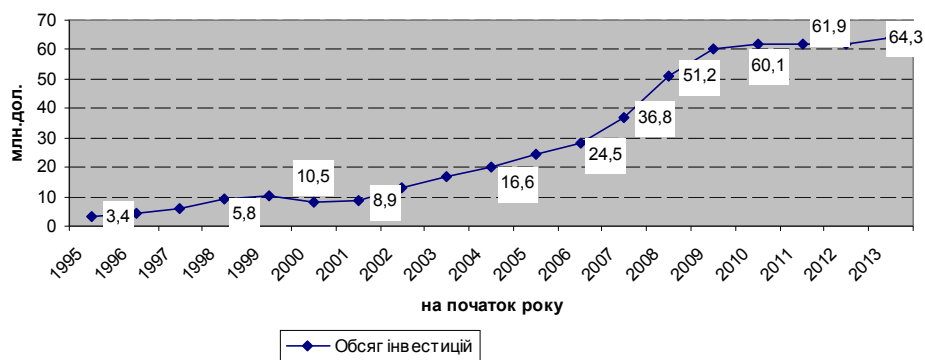
Рис. 1. Динаміка прямих іноземних інвестицій в Чернівецькій області за 1995-2013 рр. [на основі 9]