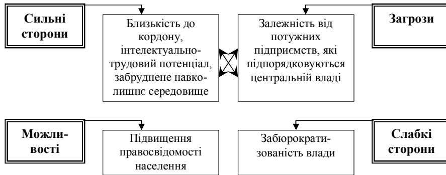
Рис. 4. SWOT-аналіз інвестиційної привабливості Чернівецької області