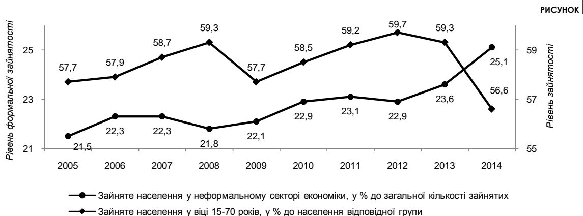
Динаміка рівнів формальної та неформальної зайнятості в 2000 – 2014 рр. 4.13