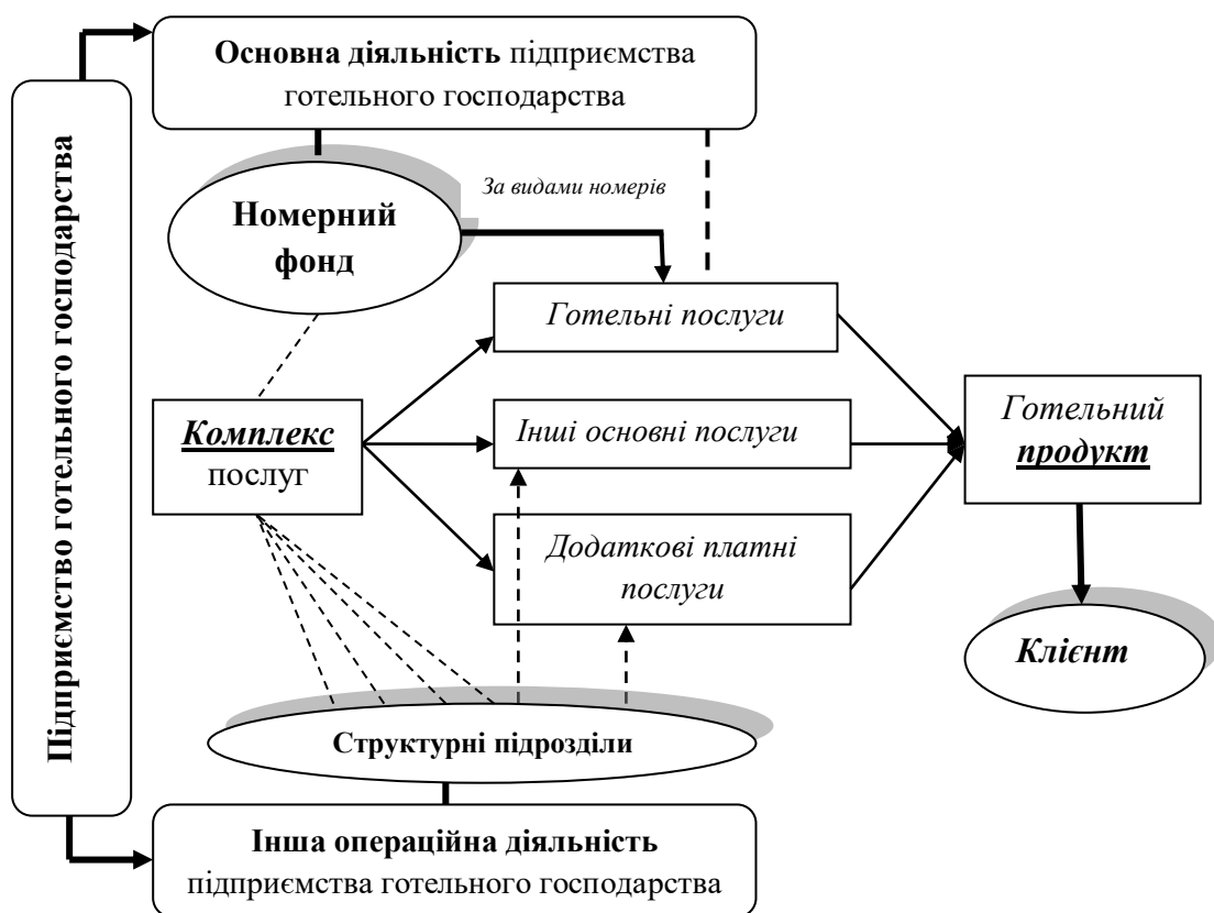
Рис. А.5.2 Місце готельних послуг в структурі операційної діяльності підприємства готельного господарства