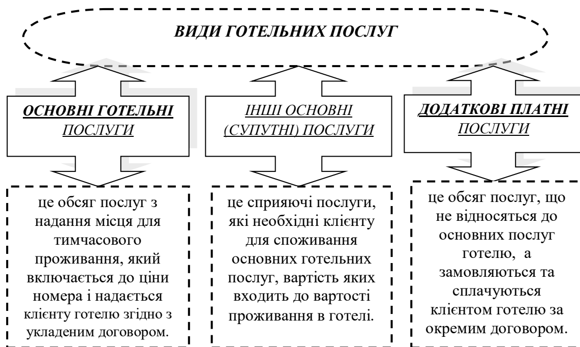
Рис. А.5.1 Класифікація послуг підприємств готельного господарства