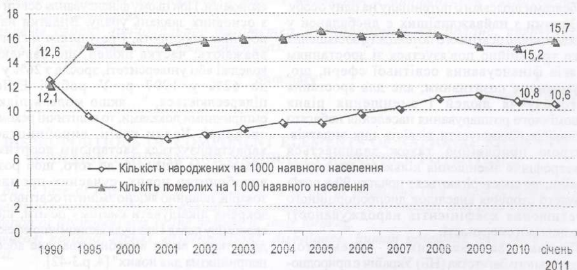
Рис. 2. Динаміка коефіцієнтів народжуваності та смертності населення України протягом 1990-2011 рр.