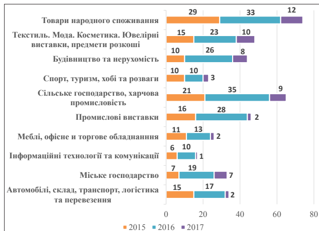
Рис. 3. Структура виставково-ярмаркової діяльності в Україні за тематичними напрямками за 2015-2017 рр.

Структура виставково-ярмаркової діяльності в Україні за тематичними напрямками віддзеркалює нинішній стан економіки України. Виставки пов'язані з будівництвом, автомобільною, легкою промисловістю, товарами народного споживання та сільським господарством є найбільш масштабними (рис. 3).